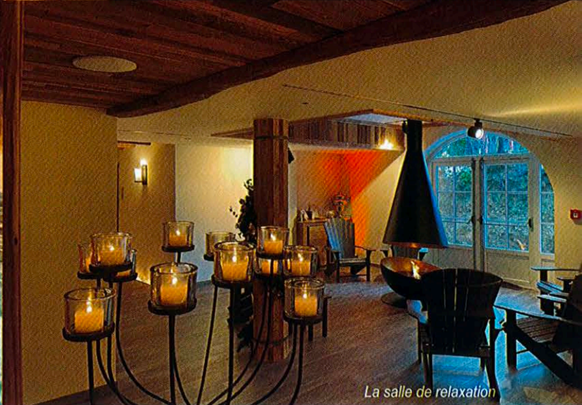
La salle de relaxation