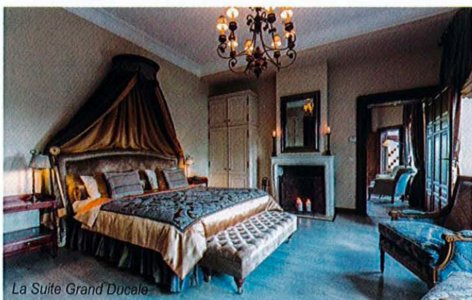
La Suite Grand Ducale

Décorées dans un style classique et subtil, créant une ambiance tout à fait romantique, les chambres du château offrent tout le confort et l'équipement nécessaires à votre prochain voyage de loisirs ou d'affaires (conférences, séminaires, incentives,...) au Luxembourg tels qu'une salle de bains privée, une literie de grande qualité, une télévision avec écran LCD, une connexion Wifi et un téléphone.