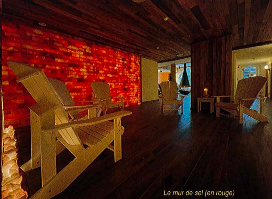
Le mur de sel (en rouge)