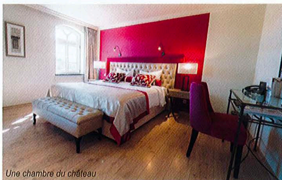
Une chambre du château

Décorées dans un style classique et subtil, créant une ambiance tout à fait romantique, les chambres du château offrent tout le confort et l'équipement nécessaires à votre prochain voyage de loisirs ou d'affaires (conférences, séminaires, incentives,...) au Luxembourg tels qu'une salle de bains privée, une literie de grande qualité, une télévision avec écran LCD, une connexion Wifi et un téléphone.